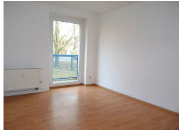
Blick ins gemütliche Wohnzimmer