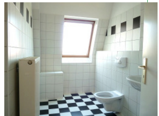
Blick ins Tageslichtbad mit Dusche

Energieausweis: Bedarfsausweis Endenergiebedarf: 105,5 kWh/(m 2 *a) Energieträger: Erdgas E Gebäude Baujahr: 1880