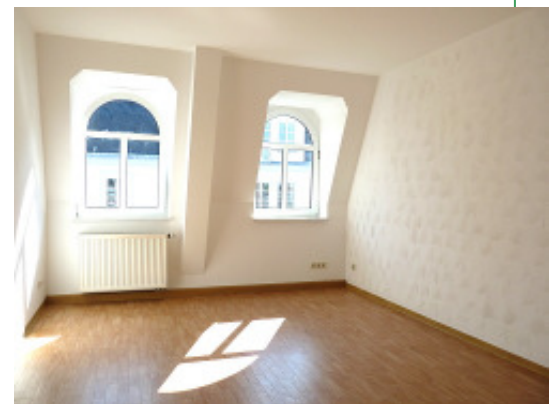
Blick ins sonnige Wohnzimmer