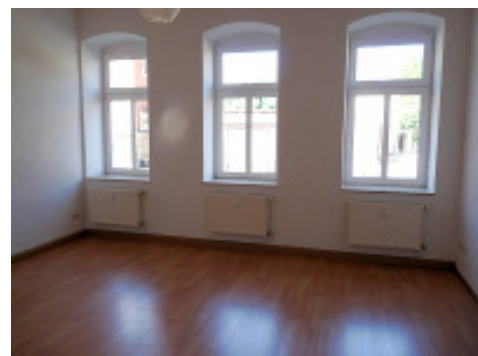
Blick in den Wohnraum